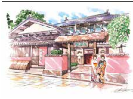
005 『舞娘茶屋 相馬樓 / 竹久夢二美術館』