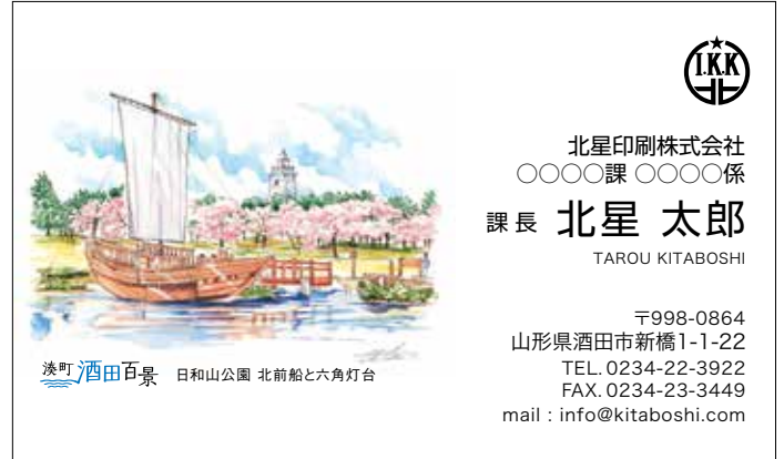
日和山公園 北前船と六角灯台