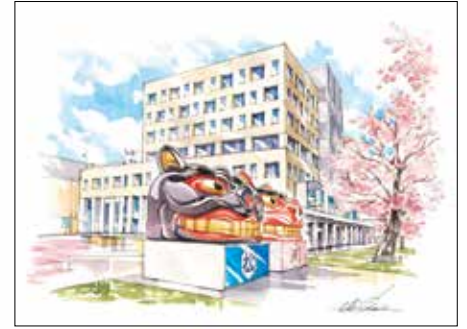
003 『酒田市役所と酒田大獅子』