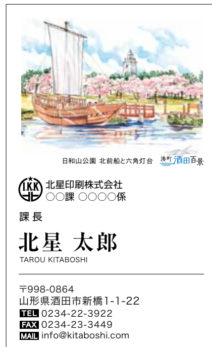
日和山公園 北前船と六角灯台