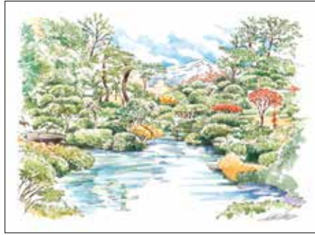
002 『本間美術館 鶴舞園』