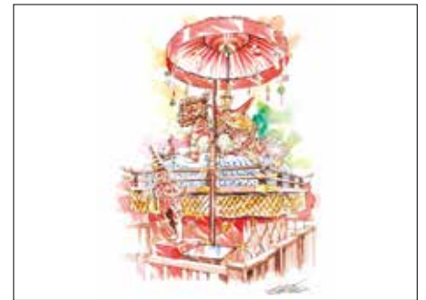
009 『酒田山王祭礼用亀笠鉦』