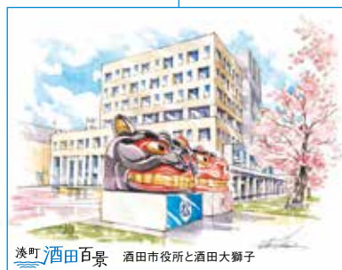
酒田百景 酒田市役所と酒田大獅子