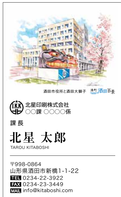
酒田市役所と酒田大獅子