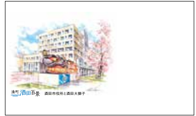
※デザインタイプ[A]イラスト番号[003]の「台紙のみ」の例