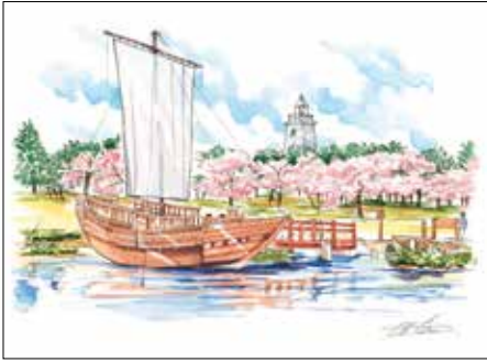
001 『日和山公園 北前船と六角灯台』