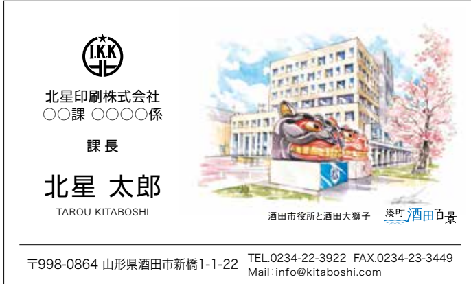
酒田市役所と酒田大獅子