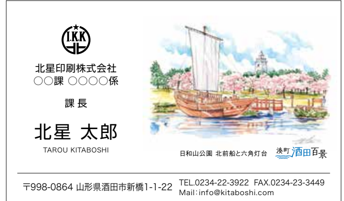
日和山公園 北前船と六角灯台