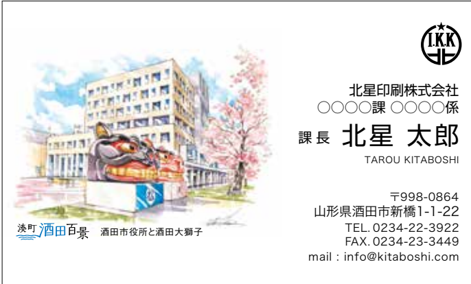
酒田市役所と酒田大獅子